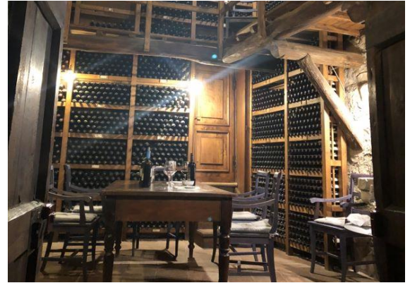
【ヴォルパイアのワイナリー「Castello di Volpaia」】

の高みに位置する。つまり、スタンプの中、狐がたたずんでいる山々の頂は、そのヴォルパイアの大地なのである。その大地こそが、招待状の差出人だったのだ。