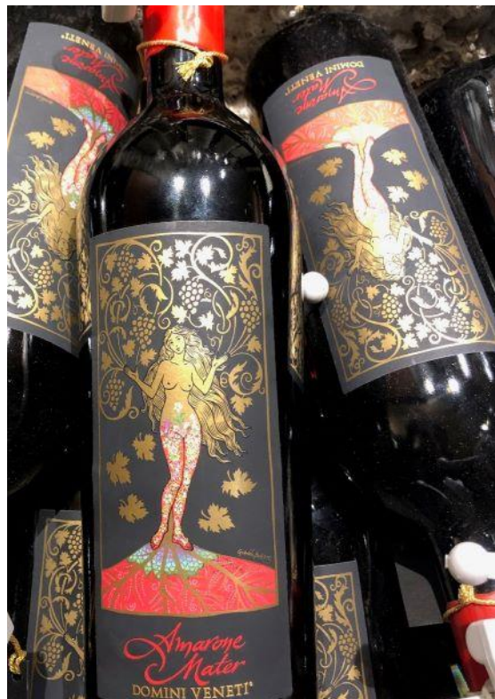
【エノテカで微笑む葡萄の女神】

まさに、モニカ・ベルッチの曲線美をデザイン化したような美女がポーズを取っている。指先から木の蔓が巻き上がっているところをみると、葡萄の精だろうか。いや、その立ち姿と腰まで届く金色の髪は、ルネサンス期の画家ポッティチェッリの名画「ヴィーナスの誕生」を彷彿とさせる神々しさだ。きっと彼女は葡萄の女神に違いない。