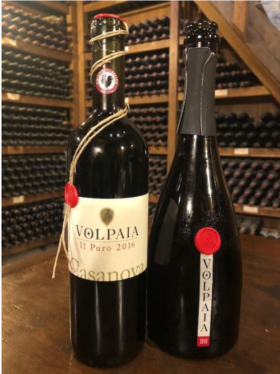
【赤い封蝋の「貴公子」と「貴婦人」】

ぜひともペアで並べておきたいが、懐事情から、なで肩の貴婦人を選んだ。メド・クラッシコと呼ばれる高品質のスプマンテ(発泡性ワイン)である。Metodo classico「伝統方式」とは、シャンパンをつくるのと同じ「瓶内二次発酵」という製法を意味する。炭酸ガスを生成させる二回目の発酵を、タンクではなく一本一本の瓶の中で行う昔ながらのやり方であるため、大変な手間がかかる。