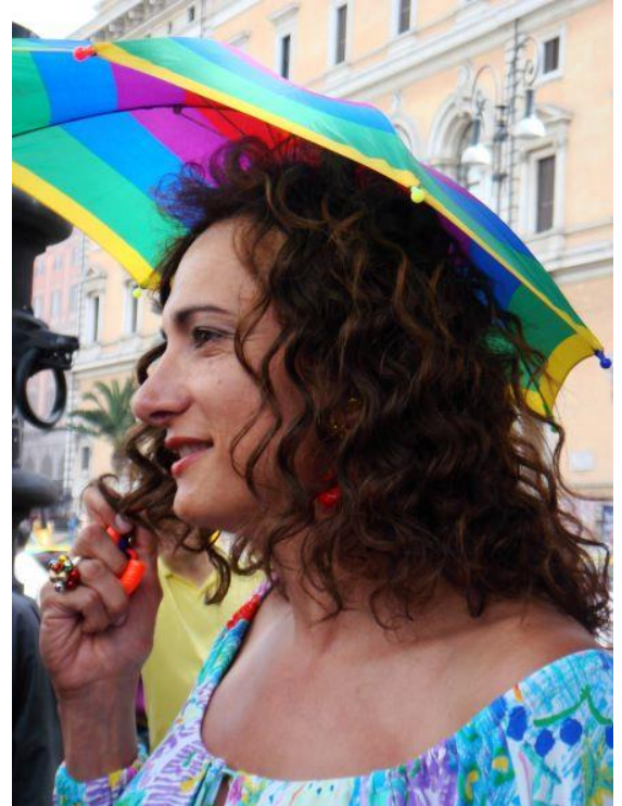
【ヴラディミール・ルクスーリア】

マ大学を卒業。性的マイノリティの活動家として、1994年にローマのPRIDEを立ち上げたのも彼女だ。同時にクラブ・イベント「ムッカッサシーナ」のオーガナイザーとして名を馳せ、その後、TVタレントとしてもブレイクする。2006年には下院議員選挙に当選し、ヨーロッパで初めて国会議員になったトランスジェンダーの肩書でも知られるようになった。