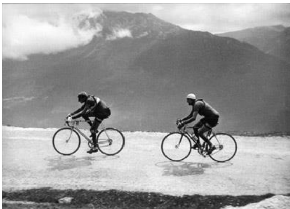
【山道を行く Coppé (左) と Bartali】

https://www.youtube.com/watch?v=Nnr2TZ2JKvs