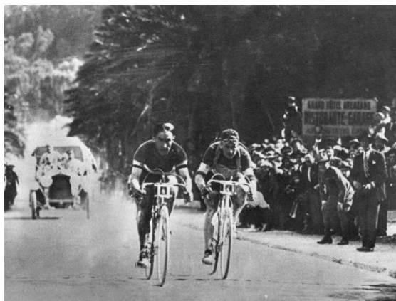
【1925年ジロの様子 走るのはジラルデンゴとビンダ】

物理的にも数10センチも離れていない、手を伸ばせばさわれるほどのすぐ目の前を選手たちは走っていく。心理的にも近しく気さくな選手たちは、それだけに尊敬の念も抱ける対象だったのだろう。