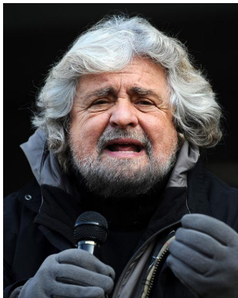
【五つ星運動党首ベッペ・グリッロ】

結局、国民投票によって原発推進案は否決された。これについてある日本の経済学者が次のようなコメントを残したのだが、それもまた印象深いものであった。「イタリア人は、国民投票の結果に狂喜乱舞しているようだが、原子力エネルギーがないと経済発展はできないぞ。それでいいのか?」。果たせるかな、イタリアは今、未曾有の経済危機の中にある。それに対して我が国は、久しぶりに経済復調の兆しを見せている。