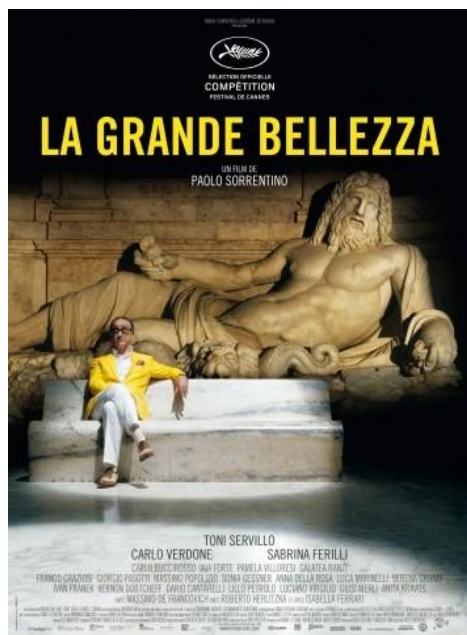
【グレート・ビューティー／追憶のローマ】 (元当館語学受講生)

最後に、見所をもう一つ付け加えておこう。そもそも私に仕事に来るはずだった観光ガイドの日本語指導なのだが、その成果や如何に…。イタリア人女優にとって、日本語を発音するというのはなかなか難しかったようで、映画の冒頭では、かなり苦労の跡が見られる。『グレート・ビューティー／追憶のローマ』は今年の秋から全国公開とのこと。他の場面も魅力的だが、冒頭の観光ガイドにも注目してみたい。